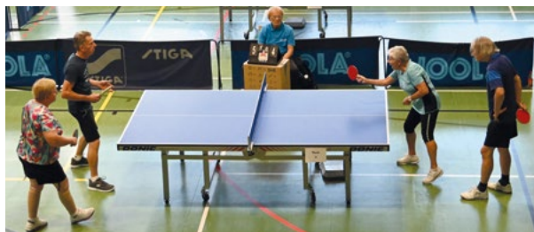
2. Österreichische Meisterschaft in Innsbruck, September 2025, Mixed Doppel-Bewerb

Wir veranstalten mit unseren Partnervereinen kleinere und größere Tischtennis-Turniere. Dabei geht es darum, gemeinsam gegen die Auswirkungen von Parkinson anzutreten und sich mit anderen Betroffenen auszutauschen. Seit Herbst 2024 sind wir Mitglied im Oberösterreichischen Tischtennisverband (ÖÖTTV). Dadurch können nun auch Österreichische Meisterschaften im Parkinson-Tischtennis stattfinden, und zwar in Zusammenarbeit mit dem Österreichischen Tischtennisverband (ÖTTV).