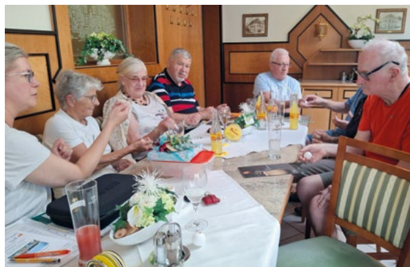
NeuroPong™-Einheit mit Tischtennisbällen bei der Parkinson-Selbsthilfegruppe Amstetten-Mauer