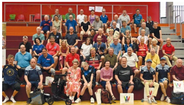
Bei der 1. Vereinsmeisterschaft im Juni 2025 in Wels