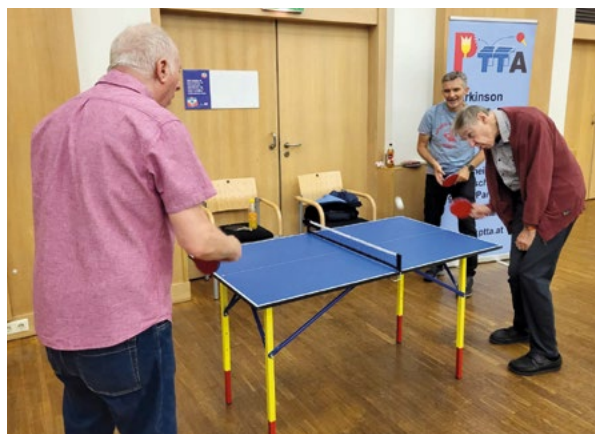
April 2025: Unser Infostand mit kleinem Tischtennis-Tisch im Neuen Linzer Rathaus. Viele Interessierte und auch viele Mitglieder von PTTA kamen vorbei, Foto: S. Doringner

Wir sind regelmäßig bei Informationsveranstaltungen zum Thema Parkinson dabei – etwa rund um den Welt-Parkinson-Tag im April. Dort stellen wir unseren Verein und unsere Trainingsorte vor und sprechen mit anderen Selbsthilfegruppen. So können wir Erfahrungen austauschen und noch mehr Menschen mit Parkinson erreichen.