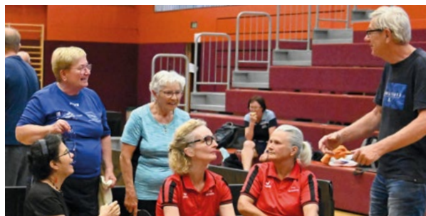
Gespräche in den Pausen fördern das Miteinander, Foto: W. Maurer