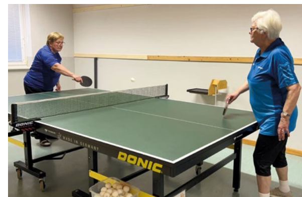
Beim Training in St. Georgen an der Ybbs

Wir möchten zeigen, dass Tischtennis ein gutes Training für Menschen mit Morbus Parkinson ist. Bewegung, Koordination und Konzentration helfen dabei, länger aktiv zu bleiben.